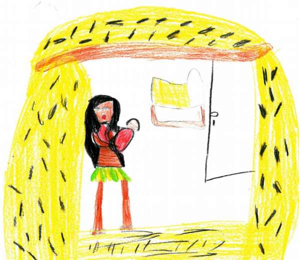
Barbora Grimová, III. třída