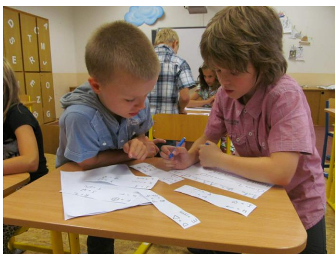
Luštění zprávy (vítězná dvojice)