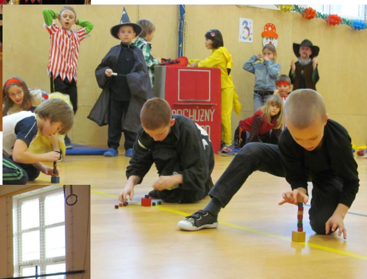
Soutěže královských družin